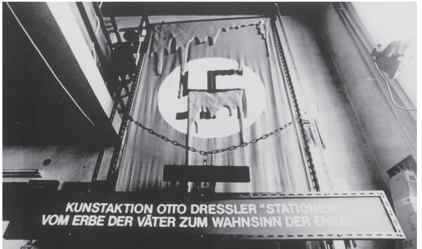
„Vom Erbe der Väter zum Wahnsinn der Enkel“ – Kunstaktion „gegen rechte Gewalt gestern und heute“ in Dachau 2005 (Organisation: Annekathrin Norrmann) und Warschau, Wien, Sofia, Berlin, München u.a.